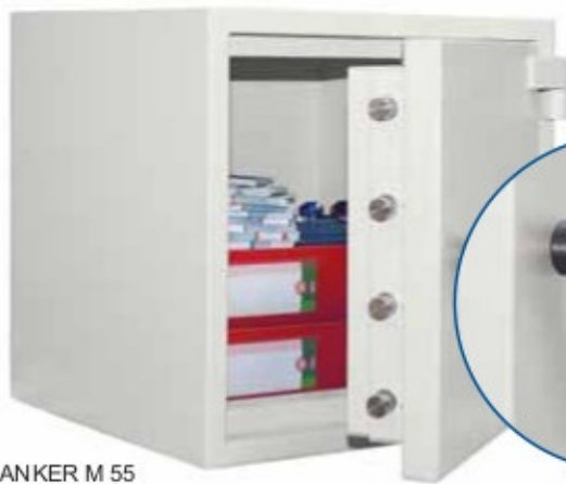
BANKER M 55